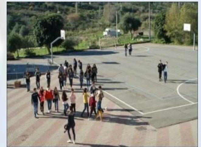
Il nostro cortile