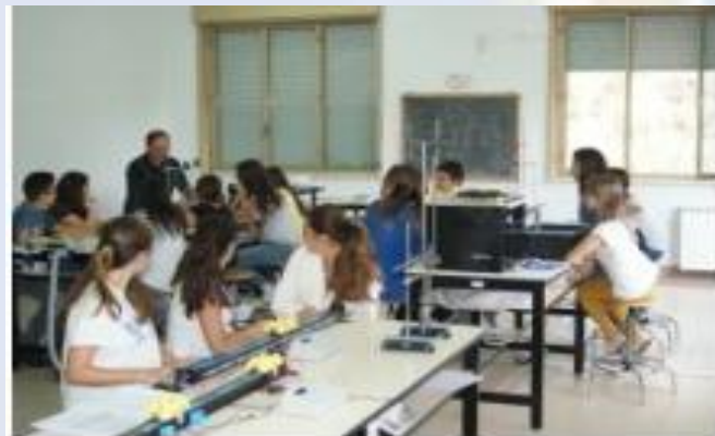
Laboratorio di Fisica