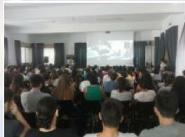
Il nostro auditorium