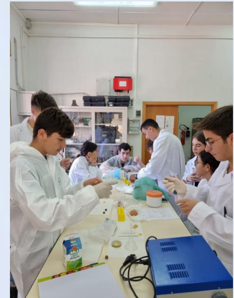
Laboratorio di Scienze