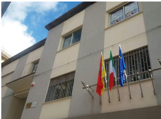
Sede di Via Monte Bianco n. 1 98037 Letojanni Tel. 0942651289